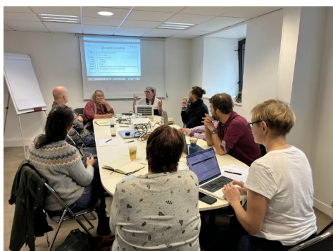
Crash test Rennes

La question de la prise en compte du vieillissement dans les habitats participatifs est une préoccupation qui prend de plus en plus d'importance pour Habitat participatif France, c'est pourquoi nous avons conclu un partenariat pour mener des ateliers d'une journée afin de présenter les résultats de RAPSODIÂ aux accompagnateur-ices de l'habitat participatif qui sont regroupé-es au sein du Rahp , Réseau national des acteurs professionnels de l'habitat participatif, et qui fait partie de HpF .