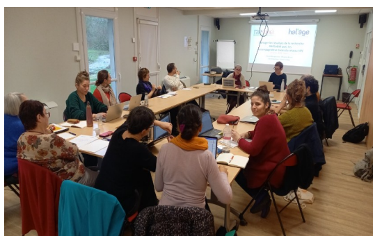
Journée d'atelier à Angers

Venu-es de Angers, Bordeaux, Clermont-Ferrand, Lyon, Marseille, Montpellier, Paris, Tours et Strasbourg, 9 accompagnatrices et 4 accompagnateurs se sont retrouvés à Angers pour une journée d'atelier. Nous avons vécu, à nouveau, « Un beau moment » de réflexion collective, d'écoute, de débats et d'échanges sensibles, un plaisir partagé.