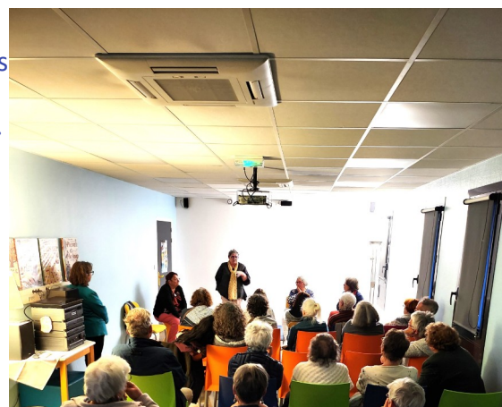
Discussion après le film