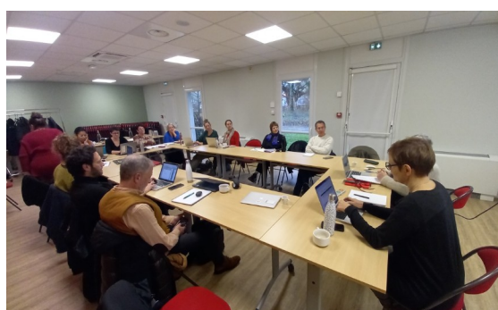
Journée d'atelier à Angers