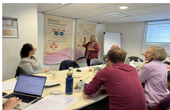
Crash test Rennes