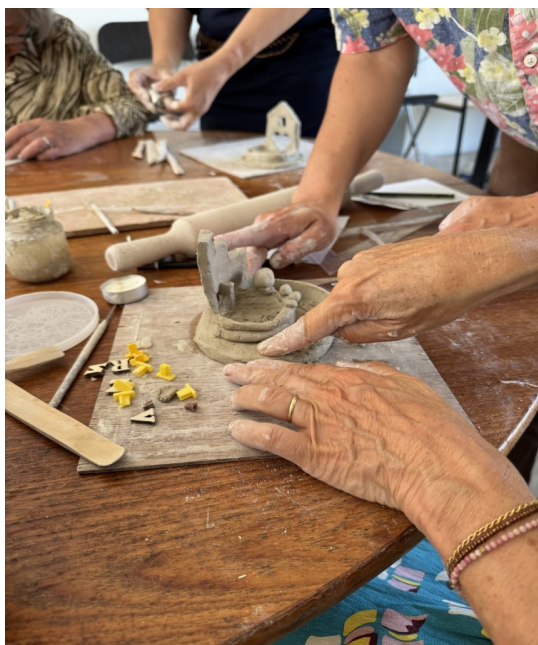
Les mains parlent

Parler de la mort en général, de la sienne, de celle de ses proches en particulier ne se fait pas sans émotion, surtout que ce n'est pas dans nos habitudes. Faire suivre ce moment particulier par une expression non verbale aura été apprécié. L'atelier a été mené par V. Jourdain de l'atelier LAC : « À l'Atelier Lac, on s'initie à la céramique dans un cadre propice à s'ancrer et à décélérer. Avec l'atelier spécial « Mémoires Vives » on peut également créer un objet dédié à nos défuntes et défunts »